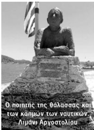
Ο ποιητής της θάλασσας και των καπμών των ναυτικών. Λιμάνι Αργοστολίου

Επισκεφθείτε το site μας www.alidromos.gr