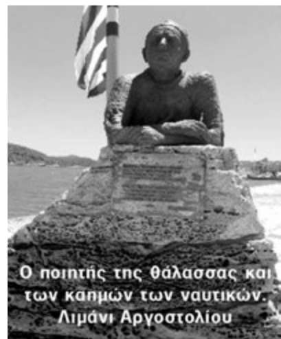
Ο ποιητής της θάλασσας και των καπμών των ναυτικών. Λιμάνι Αργοστολίου