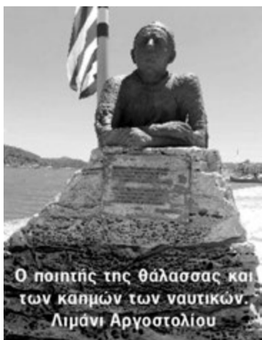
Ο ποιητής της θάλασσας και των καπμών των ναυτικών. Λιμάνι Αργοστολίου