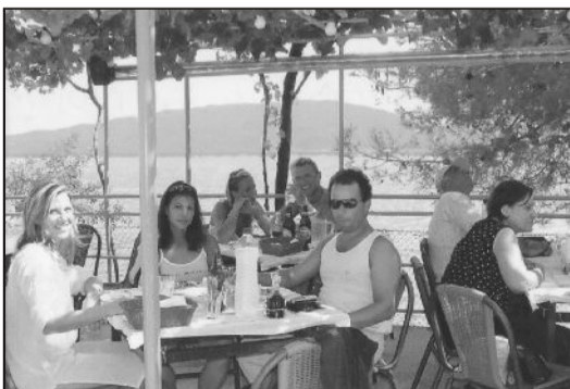
Το Εστιατόριο που επί 30 συνεχή χρόνια προσφέρει την καλύτερη ποιότητα φαγητού σε χαμηλές τιμές. Ελληνικές και ξένες σπεσιαλιτέ και τα μοναδικά "Σουφλέ Σοκολάτα" και "Σουφλέ Πορτοκάλι" με την περίφημη "Σως Σαμπαγιόν"