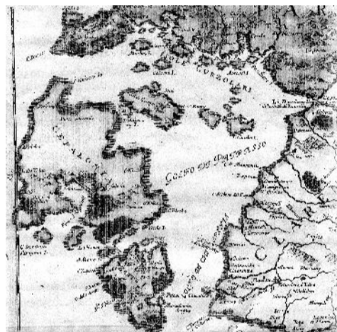
Τμήμα χάρτη του 1685-86

« Με τ' άρμενα της θάλασσας στα ρόδα των ανέμων ». Χάρτες-λιμάνια-παραθαλάσσια τοπία Κεφαλονιάς και Ιθάκης .